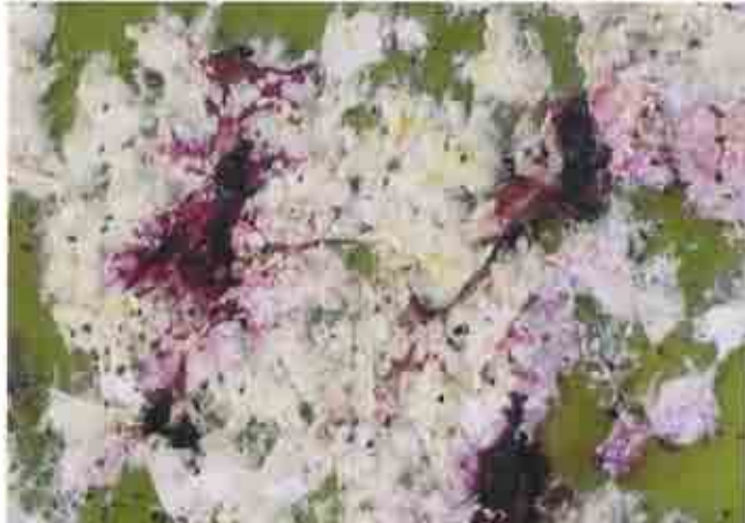
Manchas de ácido carmínico por aplastamiento de hembras.

Tanto ninfas como hembras adultas se alimentan de la palera, clavando sus estiletes bucales y chupando los líquidos de la planta. Los ataques son masivos y terminan por matar la palera. La producción de higos se pierde siempre. Los machos carecen de aparato bucal y no se alimentan.