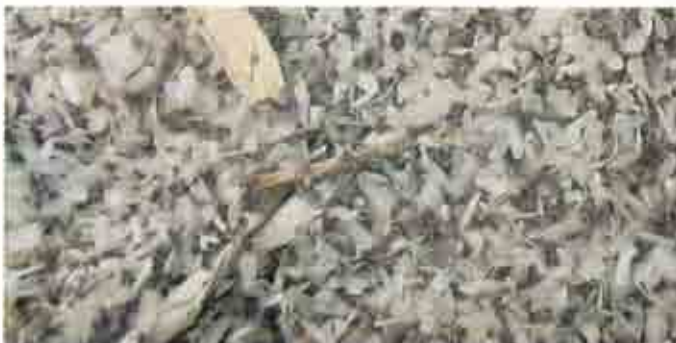
Acumulación masiva de machos alados bajo fuente de luz.