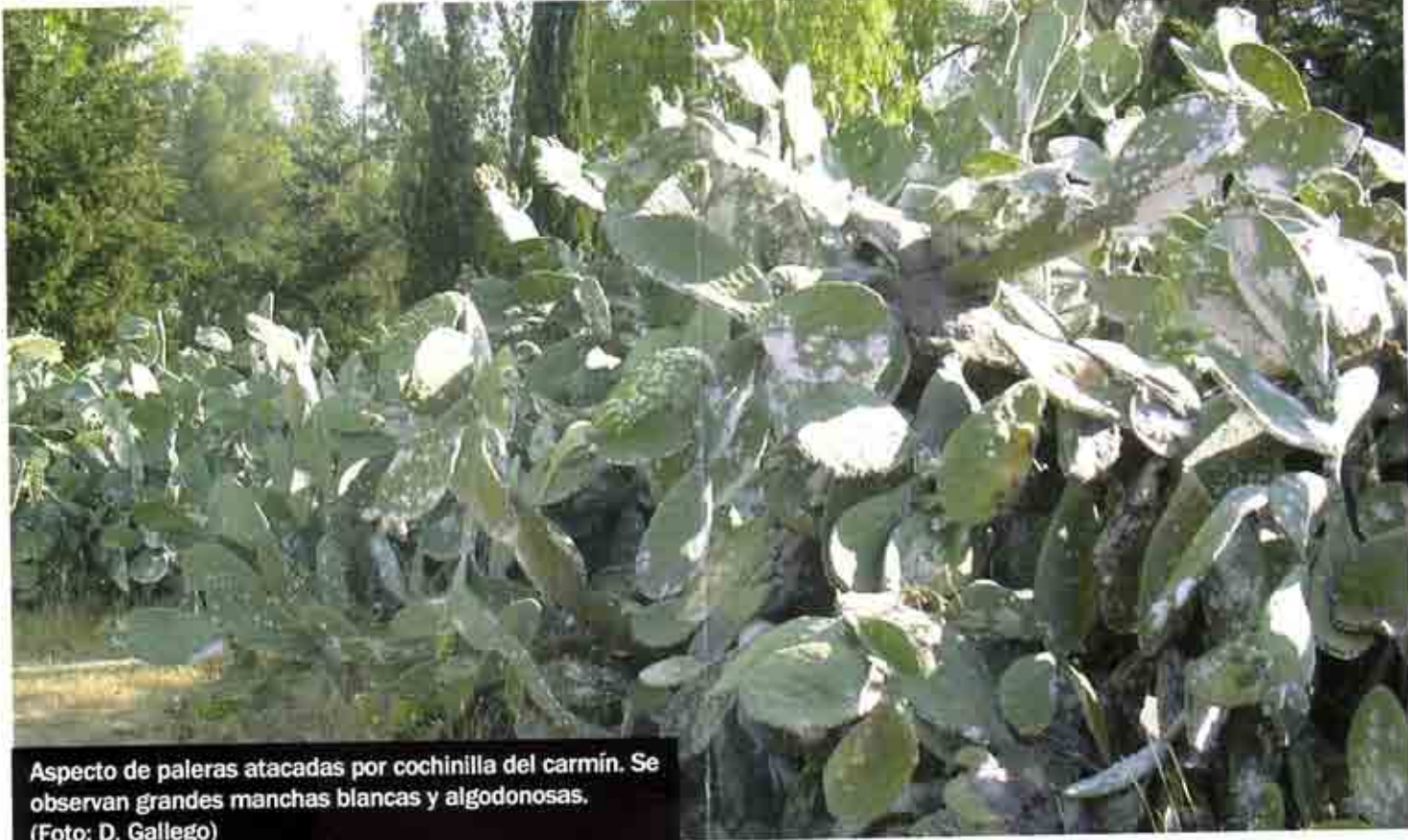
Aspecto de paleras atacadas por cochinilla del carmín. Se observan grandes manchas blancas y algodonosas.