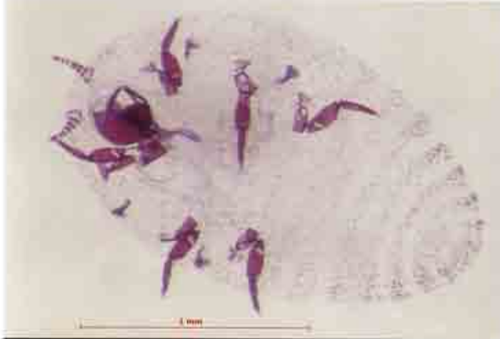
Hembra de cochinilla del carmín vista al microscopio.

Tanto ninfas como hembras adultas se alimentan de la palera, clavando sus estiletes bucales y chupando los líquidos de la planta. Los ataques son masivos y terminan por matar la palera. La producción de higos se pierde siempre. Los machos carecen de aparato bucal y no se alimentan.