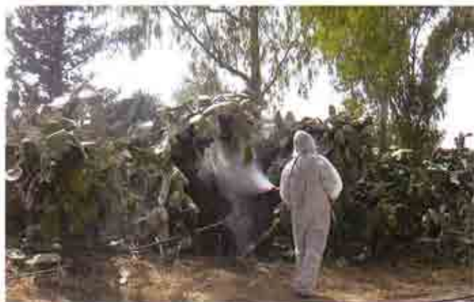
Aplicación de insecticidas sobre paleras para el control de la cochinilla del carmín.