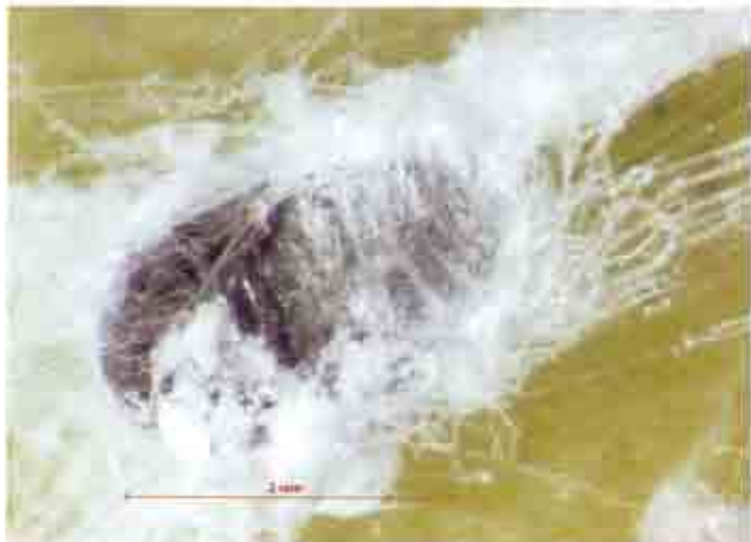
Hembra adulta a la que se ha retirado parcialmente la cobertura algodonosa.