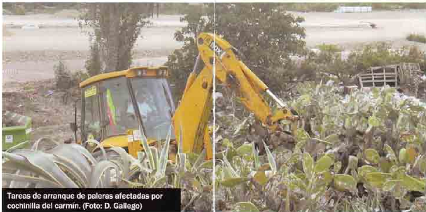
Tareas de arranque de paleras afectadas por cochinilla del carmín.