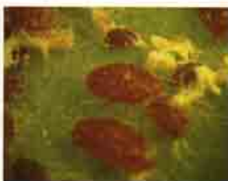
Ninfas de primera y segunda muda.

Ninfas de primera muda. Se observan las secreciones filamentosas que les sirven para ser arrastradas por el viento y colonizar nuevas paleras, tanto a corta como a larga distancia.