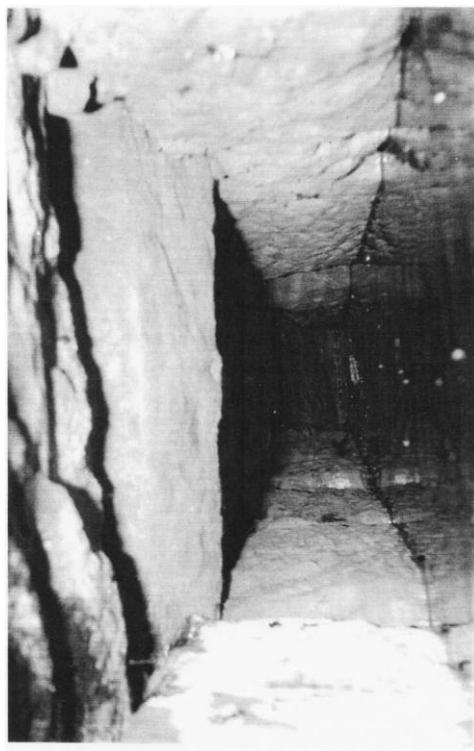
Fotos del interior de la fuente.